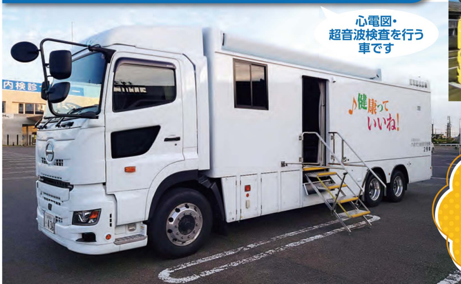
循環器・超音波併用検診車