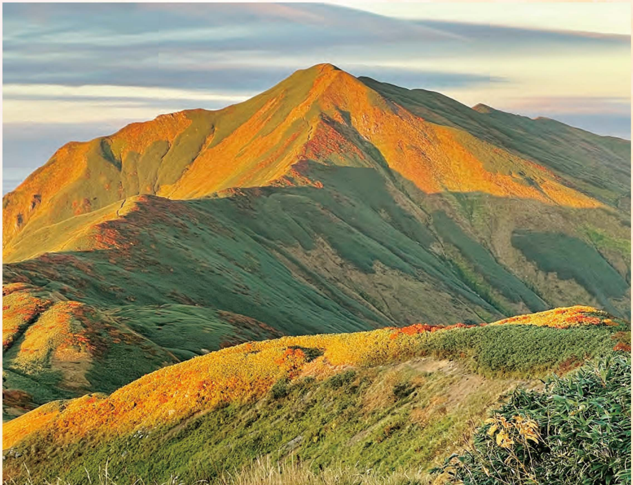
飯豊連峰 御西小屋からみた朝焼けの大日岳