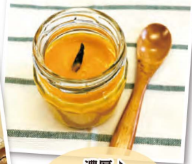
濃厚♪ かぼちゃプリン