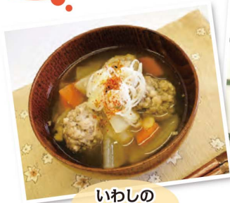
いわしの つみれ汁