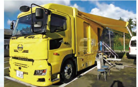
胃・呼吸器併用検診車