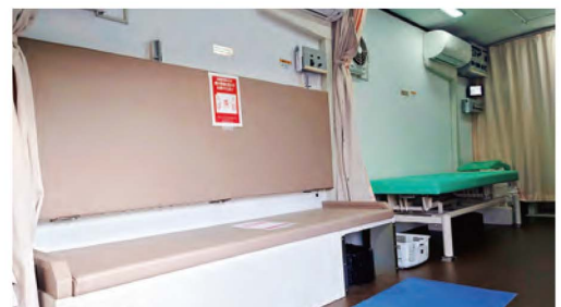
現在は椅子ですが、背もたれ部分を下ろすとベッドに早変わり

当機構では胃部・呼吸器併用検診車が8台、呼吸器検診車が1台、循環器検診車が1台、循環器・超音波併用検診車が2台と、合計12台の検診車を配置しております。山形県内全域にて、検診車が直接皆さまの地域に伺いますので、お住まいの近くの公民館などで受診される際にご利用ください。