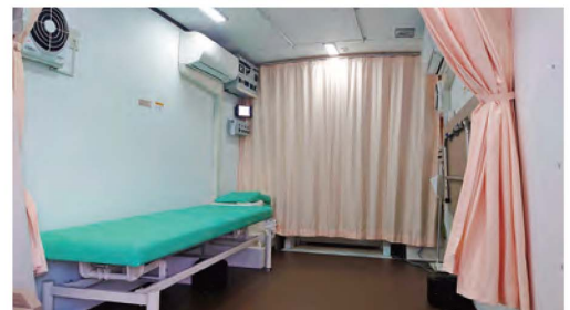
心電図・超音波検査スペース