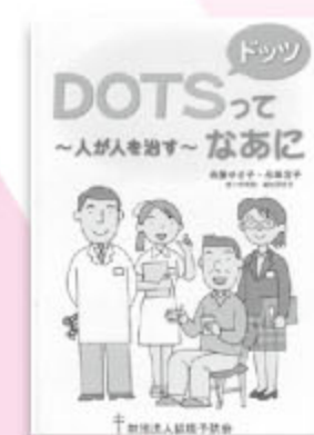
DOTSってなあに ～人が人を治す～ 241円