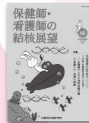
保健師・看護師の 結核展望95号 1,995円