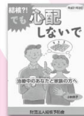
結核?!でも心配しないで 平成21年改訂版 241円