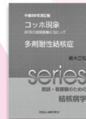
コッホ現象/多剤耐性結核症 平成22年改訂版 1,260円