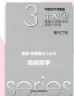
第3巻 治療① 平成22年改訂版 1,260円