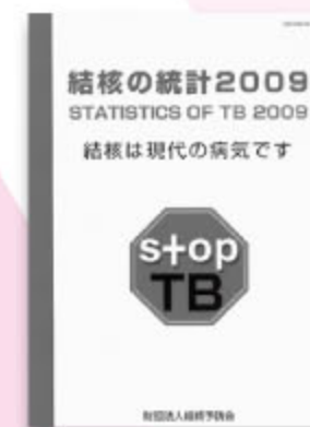
結核の統計 2009 3,150円 ※ 2010年版は 9月に完成予定です